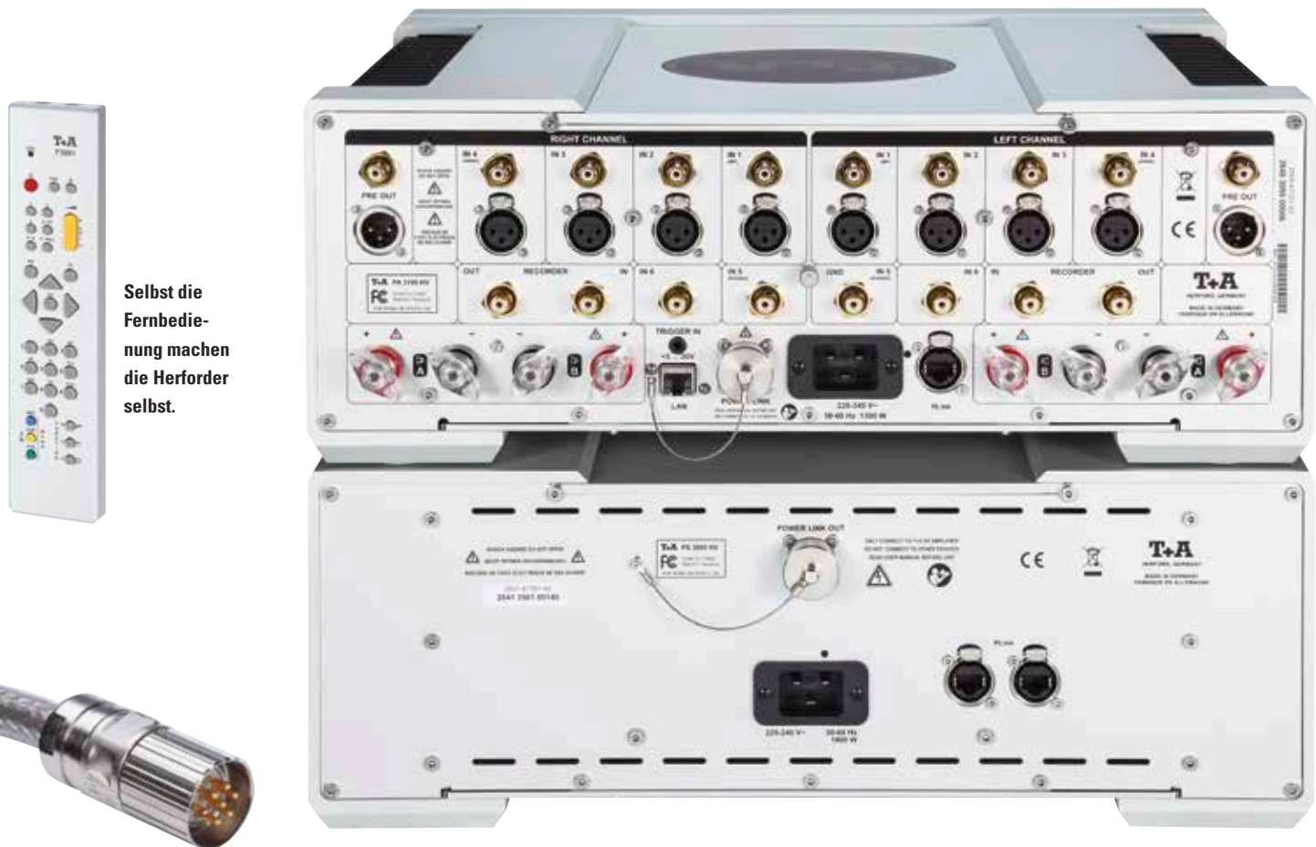
Selbst die Fernbedienung machen die Herforder selbst.